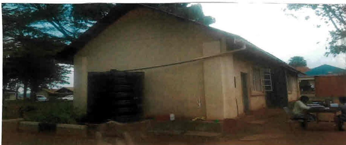
Unten: Ansicht des alten Gebäudes von hinten