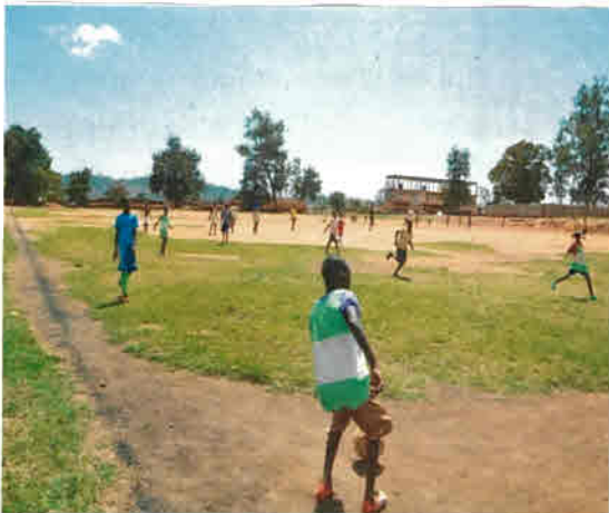
Unten: Kinder spielen Fußball auf dem Spielfeld