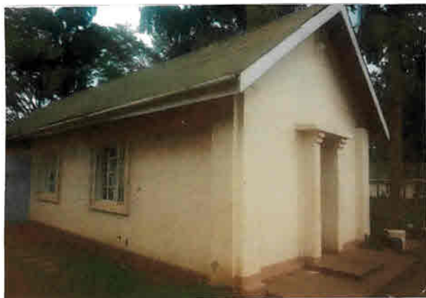
Oben: Ansicht des alten Gebäudes von vorne