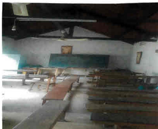
Oben rechts: Alte Innenansicht