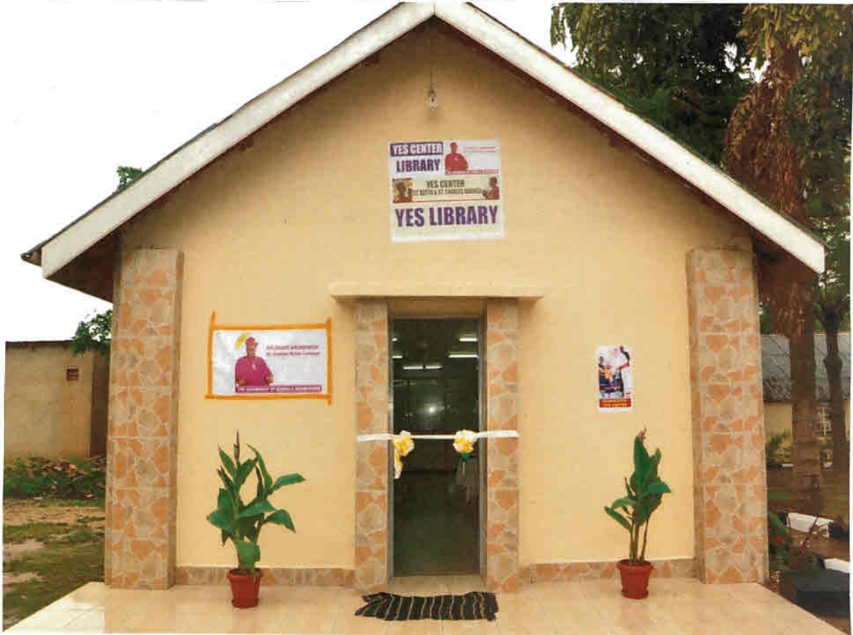
Der neue Anbau der Bibliothek